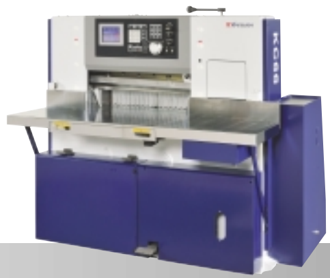
Paper Cutting Machine KC66